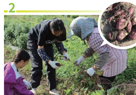
2 收割蔬菜或釣魚 採摘野菜等