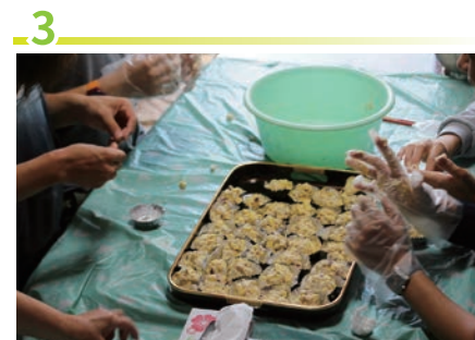
3 使用收割的蔬菜製作菜品