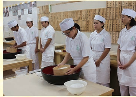
▲高田高中的「蕎麥麵隊」曾參加過高中生全國大賽。