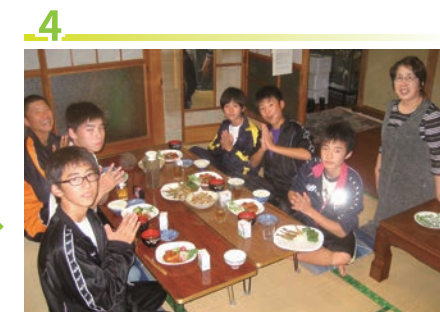
4 晚餐、洗澡 (※家庭浴室或當地溫泉施設)