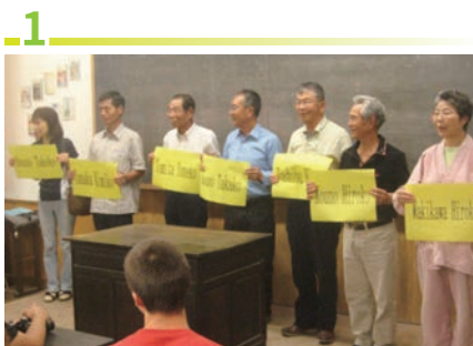
1 歡迎典禮 搭乘戶主家車移動