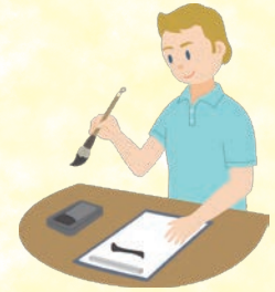
體驗書道等日本文化