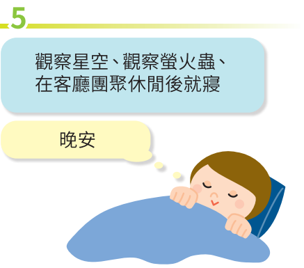
5 觀察星空、觀察螢火蟲、 在客廳團聚休閒後就寢