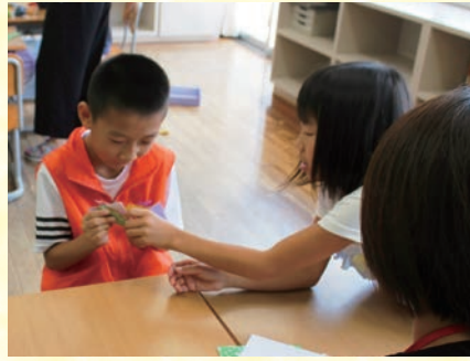
▲在香港地小學體驗折紙和劍玉等日本遊戲。