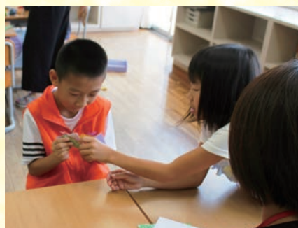
▲在香港地小学体验折纸和剑玉等日本游戏。