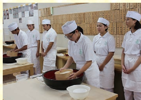
▲高田高中的“荞麦面团”曾参加过高中生全国大赛。