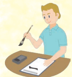
体验书道等日本文化